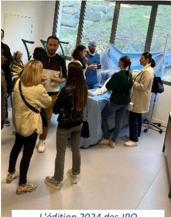
L'édition 2024 des JPO

Samedi 25 janvier 2025 / Samedi 1 er Février 2025 / Samedi 8 Février 2025