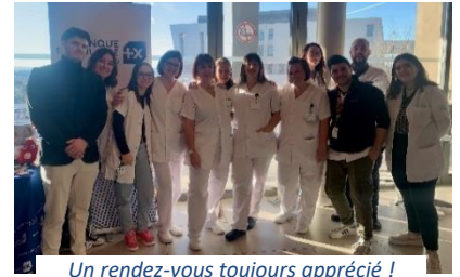
Un rendez-vous toujours apprécié !

Pour ses prochaines Journées portes ouvertes, l'Institut de Formation aux Métiers de la Santé (IFMS) du CHU de Nîmes propose trois dates auxquelles sont conviés toutes celles et ceux qui souhaitent intégrer le monde de la Santé. À travers les différents stands et ateliers, les visiteurs pourront d'une part découvrir les locaux et les équipements de l'IFMS de Nîmes et le tout nouveau Pôle d'Enseignement Supérieur du Vigan, et d'autre part échanger avec des formateurs, des professionnels, des étudiants ainsi que des jeunes diplômés.